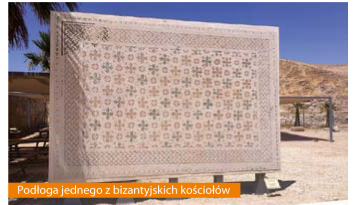
Podłoga jednego z bizantyjskich kościołów

Muzeum zewnętrzne zawiera takie mozaiki jak: podłoga krypty kościoła w Horvat Berachot (Khirbet Bureikut),