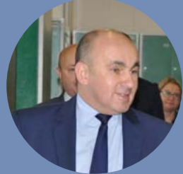
Wojciech Cybulski - Warmińsko - Mazurski Wicekurator Oświaty